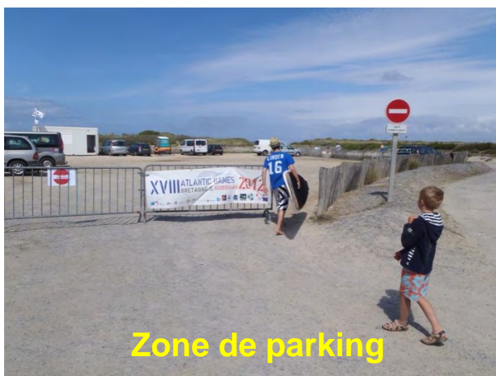
Zone de parking