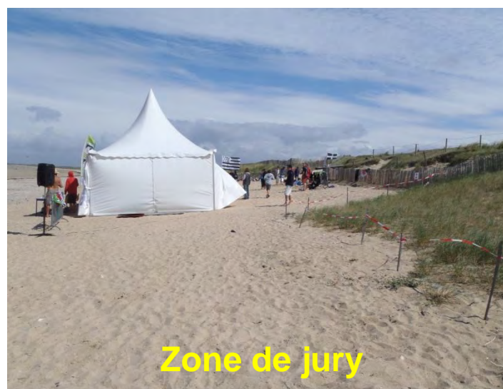
Zone de jury