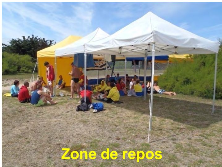
Zone de repos