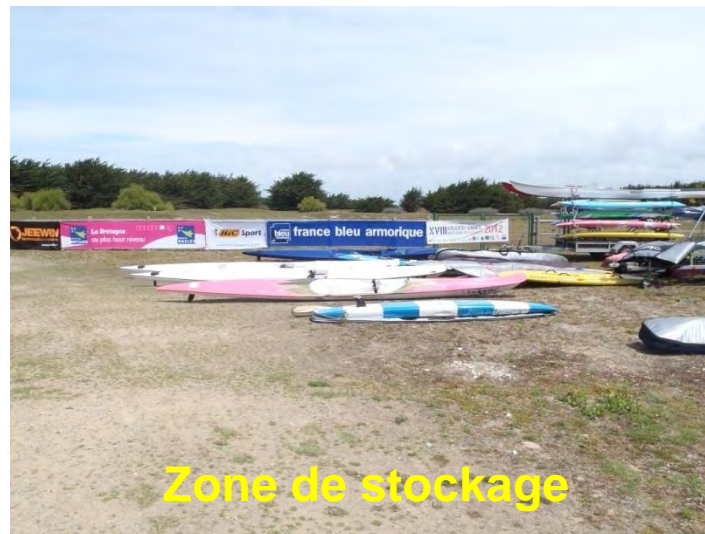
Zone de stockage