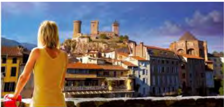
UNE VIE DE CHÂTEAU www.ariège-tourisme.com