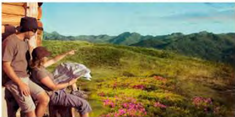
VERT AUTRE PART www.ariège-tourisme.com