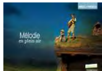
Mélo die en plein air