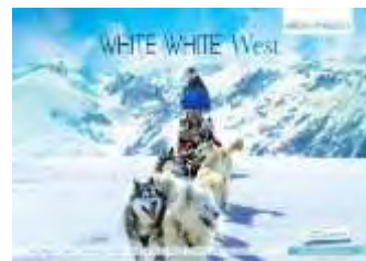
WHITE WHITE West