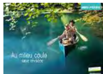
Au milieu coule une rivière