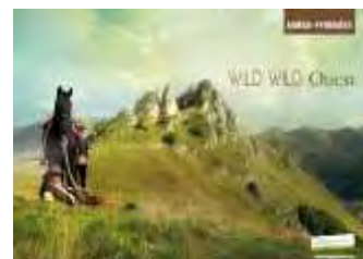
WILD WILD Choc