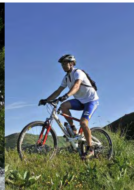
Schéma de développement du tourisme et des loisirs 2011-2015